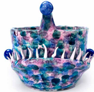
ANGLER FISH AZUL

CUENCO (500 ml) ANGLER FISH AZUL CU-ANG-AZU-23