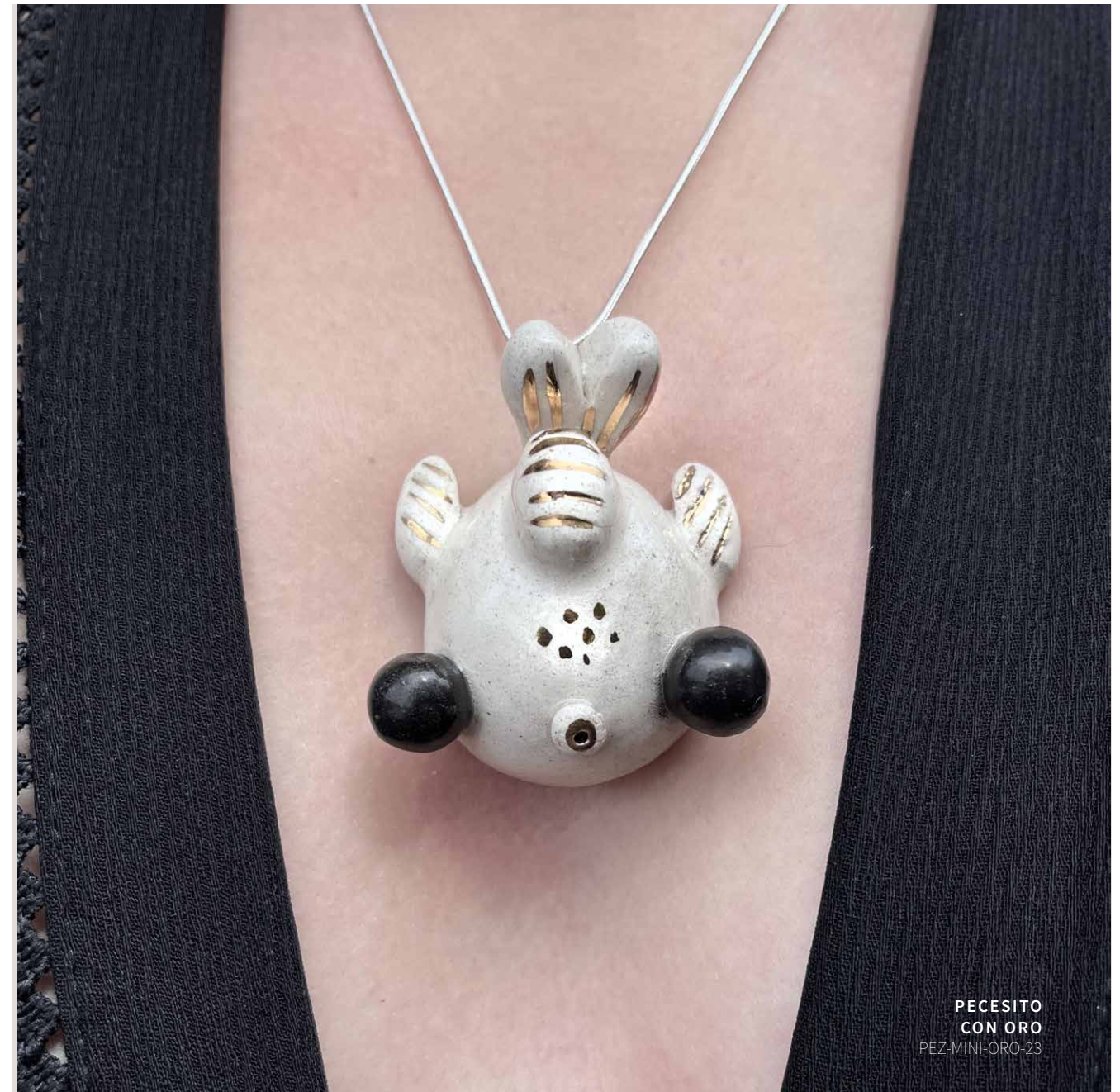
PECESITO CON ORO PEZ-MINI-ORO-23