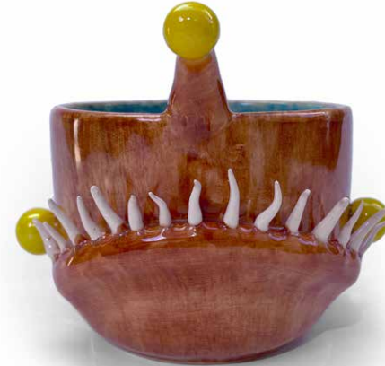
ANGLER FISH CAFÉ

CUENCO (500 ml) ANGLER FISH CAFÉ CU-ANG-CA-23