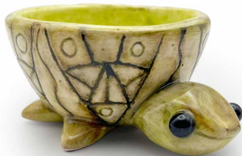
JUEGO 4 MEZCALEROS TORTUGA MEZ-TOR-23