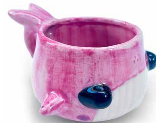
TAZA DE BALLENA PINK

TAZA DE BALLENA (250ml) ESMALTE ESPECIAL T-BA-CH-EE-22