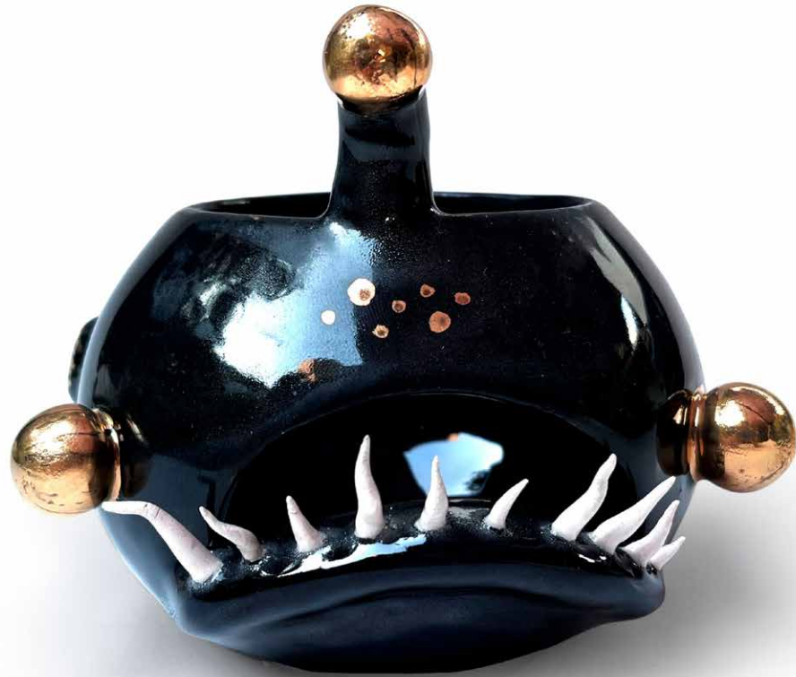
COME ESTAMBRE ANGLER FISH ORO CE-AN-ORO-23