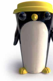
THERMO DE PINGÜINO

VASO (450ml) BALLENA SATURNO VA-G-BA-SA-22