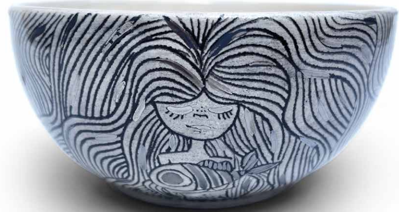
BOWL (450ML) SIRENA 01 BOWL-SI-01