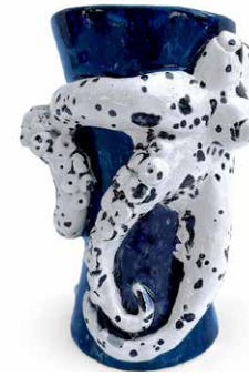
VASO DE PULPO