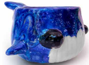
TAZA DE BALLENA ESMALTE ESPECIAL