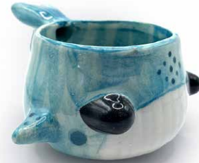
TAZA DE BALLENA MENTA