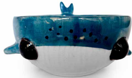
BOWL DE BALLENA