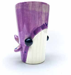
VASO BALLENA SATURNO