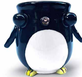
TAZA PINGÜINO DETALLES DE ORO

TAZA (250ml) BALLENA CON ORO T-BA-CH-ORO-22