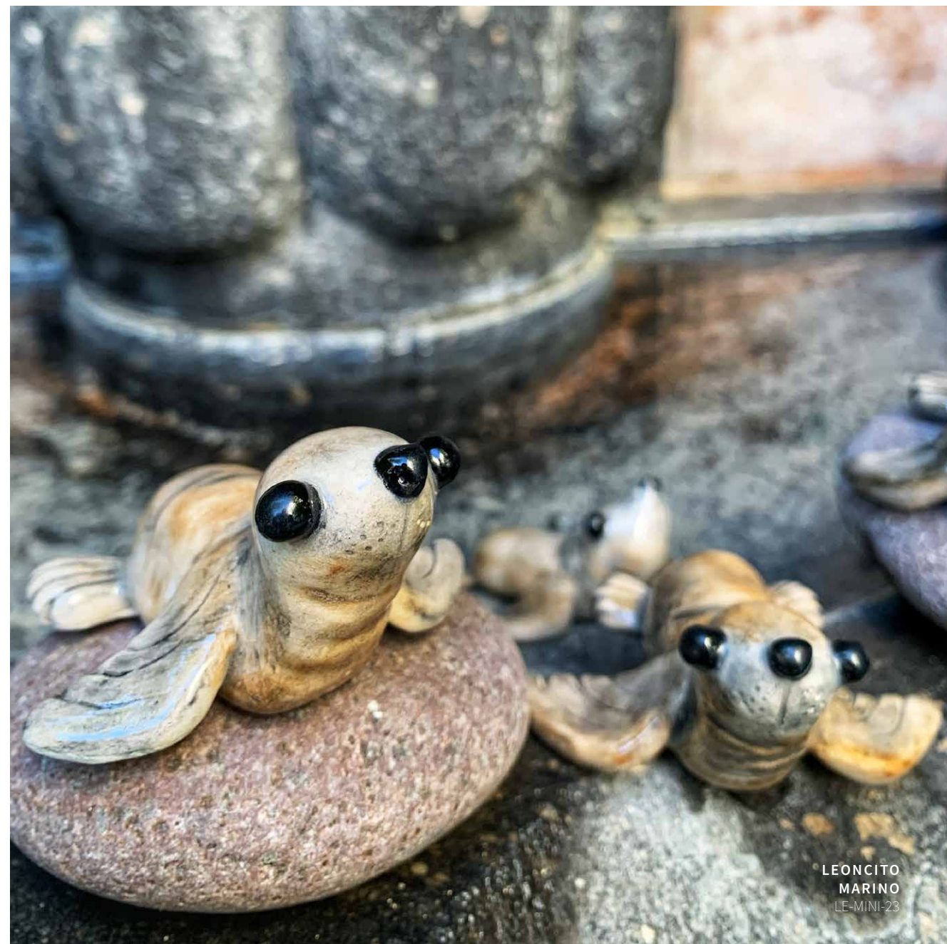
LEONCITO MARINO LE-MINI-23