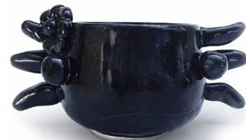
TAZA CARA MISS AJOLOTE NEGRO