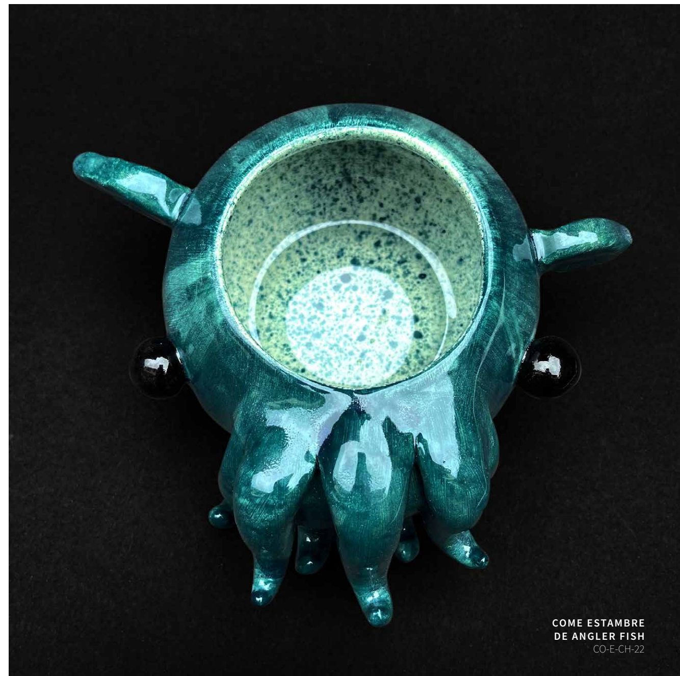
COME ESTAMBRE DE ANGLER FISH CO-E-CH-22