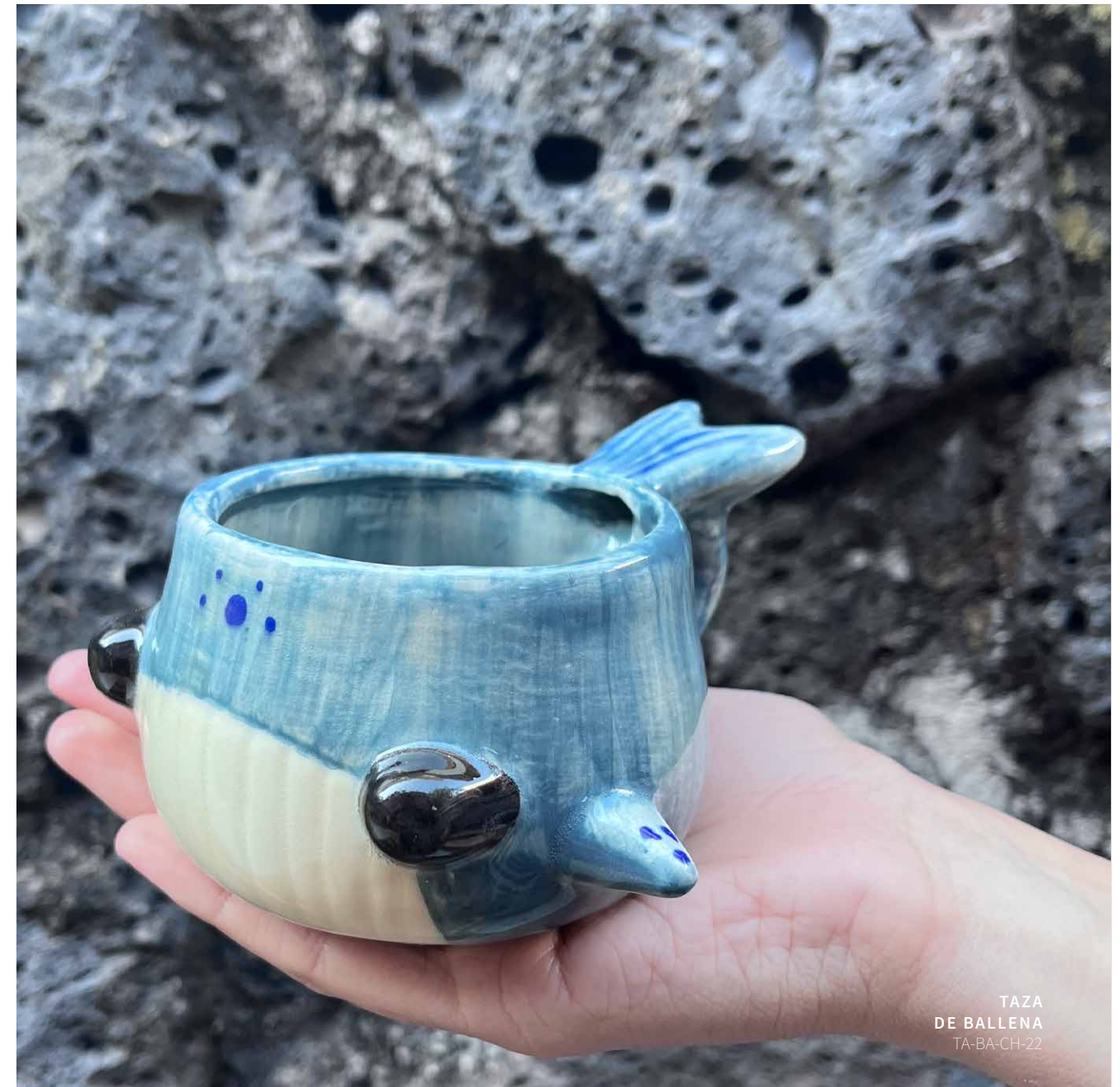
TAZA DE BALLENA TA-BA-CH-22