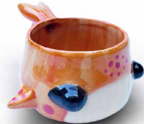
TAZA DE BALLENA MELÓN

TAZA DE BALLENA (250ml) PIÑA T-BA-CH-PI-23