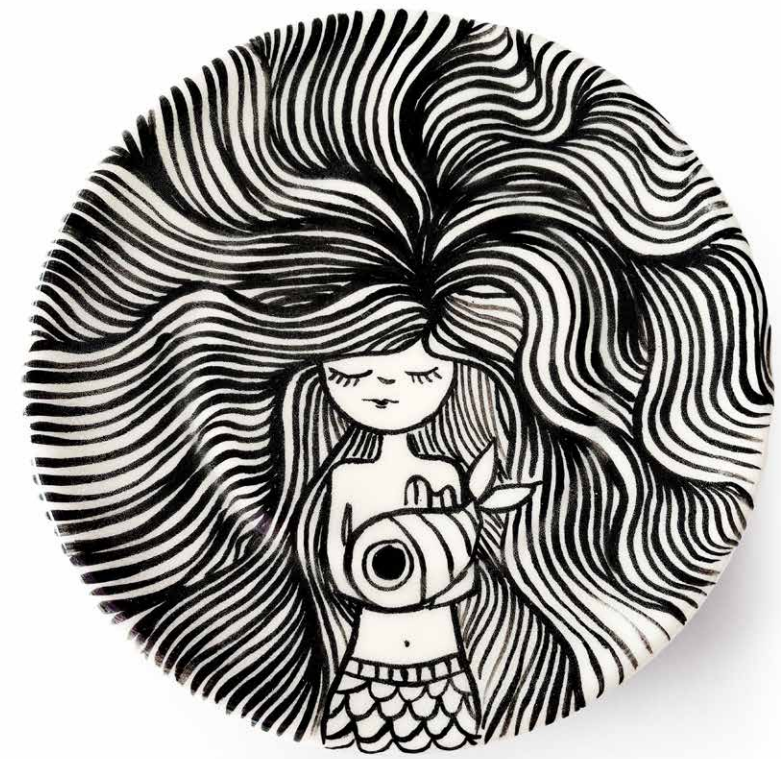
PLATO (MEDIANO) SIRENA 01 PL-M-SI-02