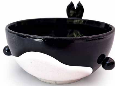
BOWL DE ORCA