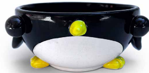
BOWL DE PINGÜINO