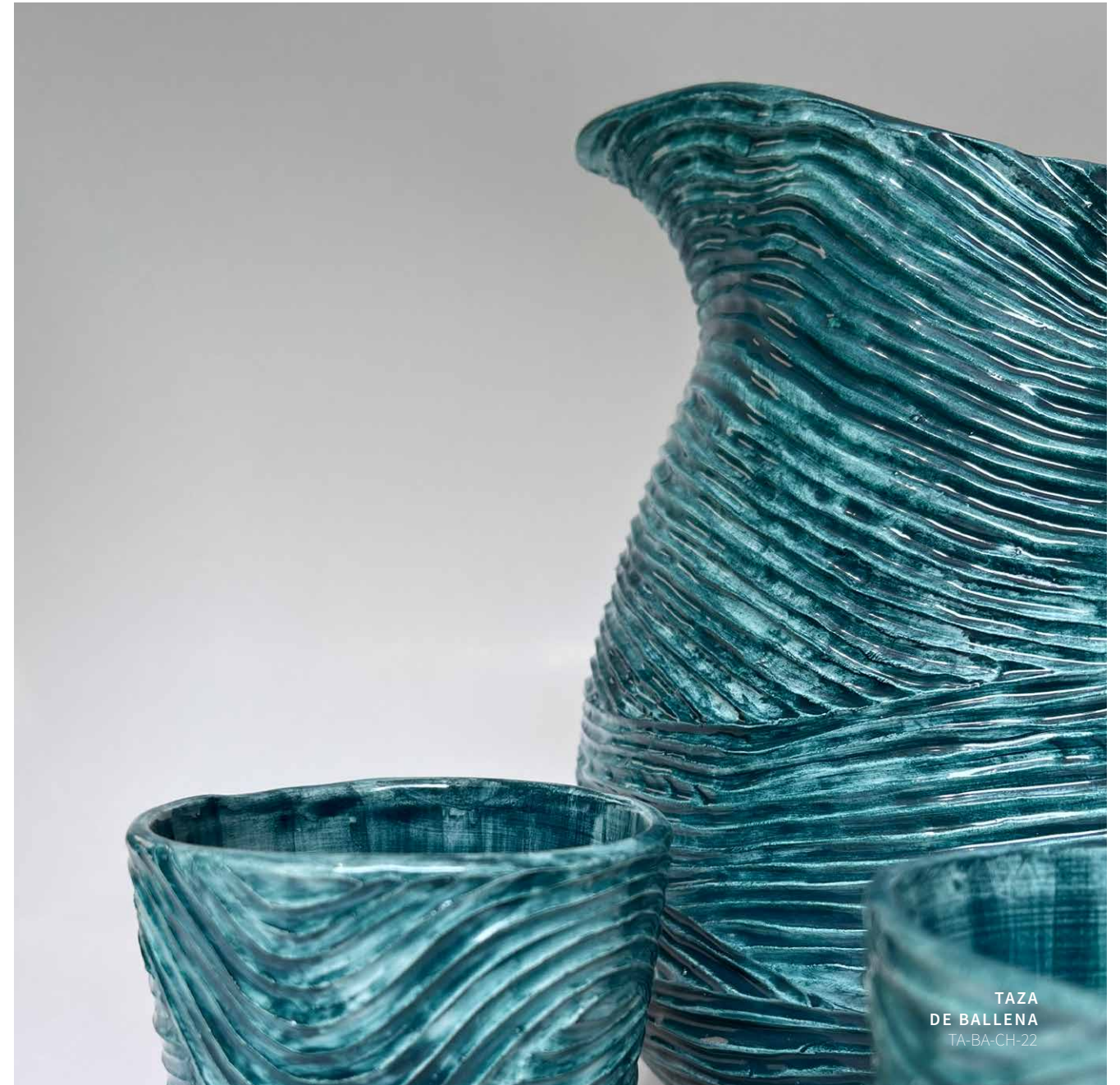
TAZA DE BALLENA TA-BA-CH-22