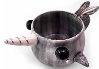
TAZA NARVAL DETALLES DE ORO