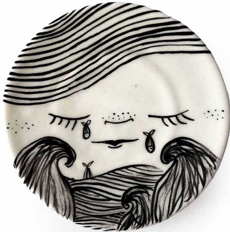
PLATO (MEDIANO) NIÑA 01 PL-M-NI-01