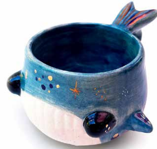
TAZA BALLENA DETALLES DE ORO