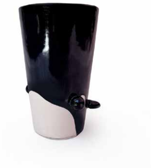
VASO DE ORCA