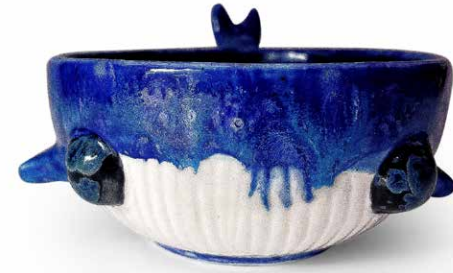
BOWL DE BALLENA 400ML ESMALTE ESPECIAL