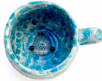
TAZA BALLENA SORPRESA