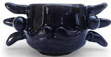
TAZA CARA MR AJOLOTE NEGRO