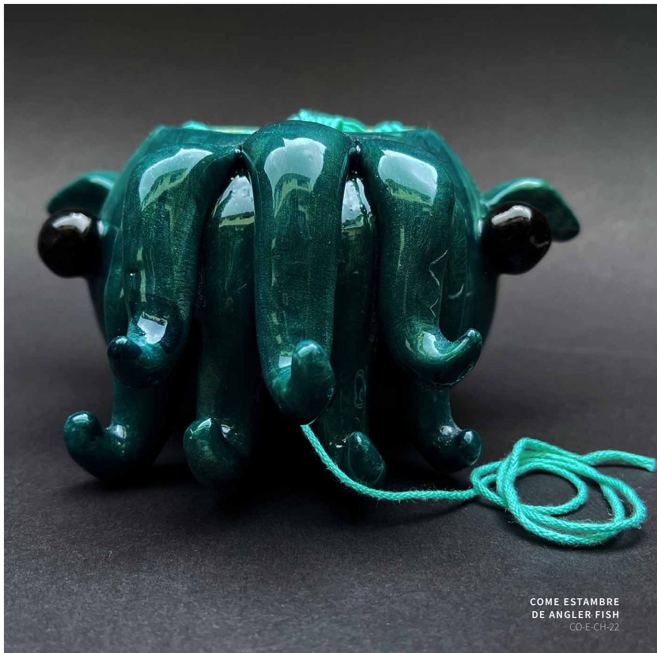
COME ESTAMBRE DE ANGLER FISH CO-E-CH-22