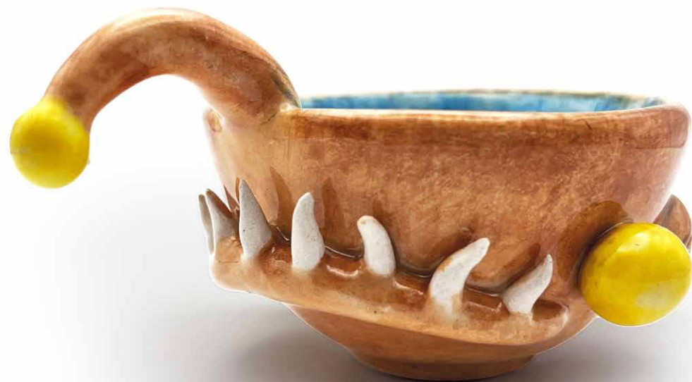
JUEGO 4 MEZCALEROS ANGLER MEZ-ANG-23