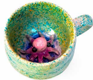
TAZA PULPO SORPRESA