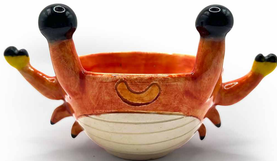
JUEGO 4 MEZCALEROS CANGREJO MEZ-CAN-23