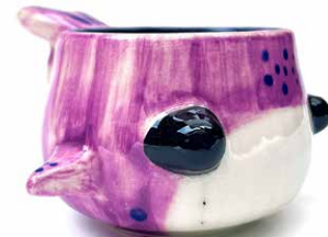
TAZA DE BALLENA SATURNO