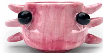
TAZA CARA DE AJOLOTE ROSA 250 ML