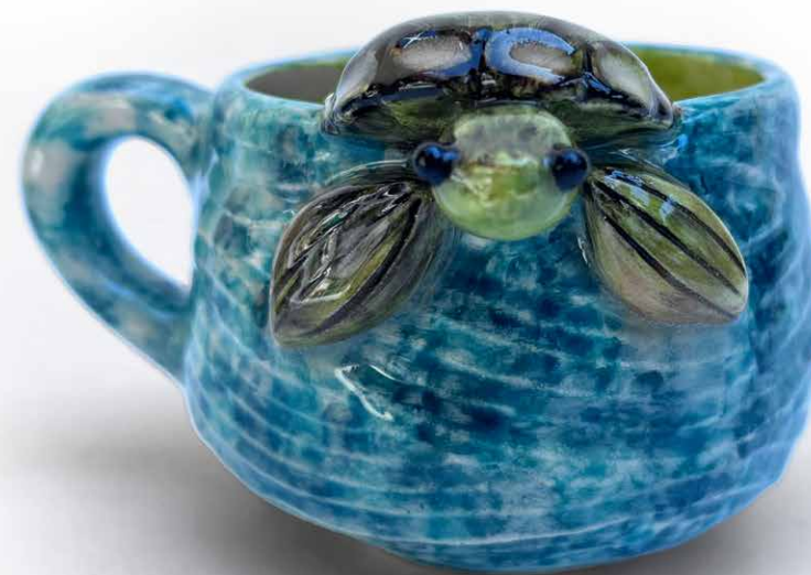
TAZA (200ml) DE TORTUGA ASOMADA TZ-TO-CU-22