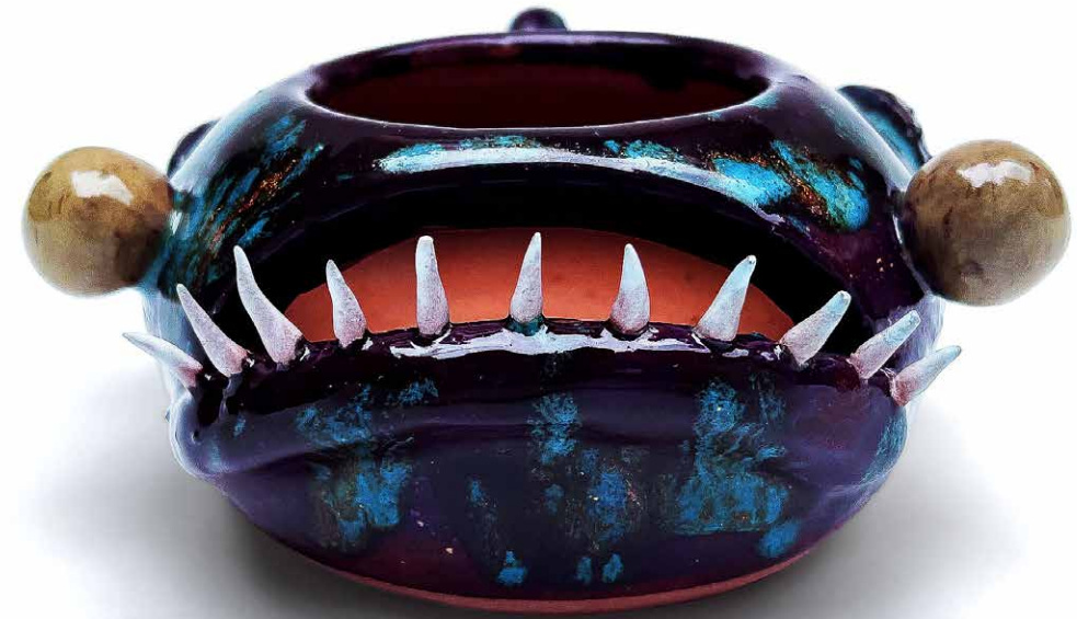
INCIENCERO ANGLER FISH ESMALTE ESPECIAL IN-AN-ORO-23