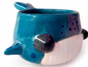
TAZA DE BALLENA