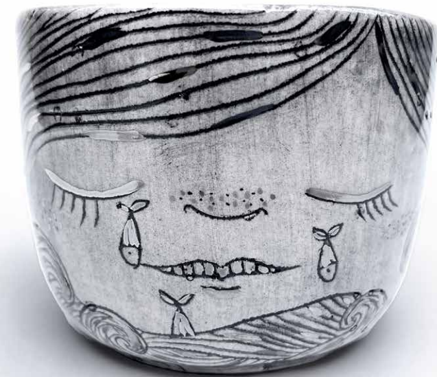
CUENCO (500ML) NIÑA 01 CU-NI-01