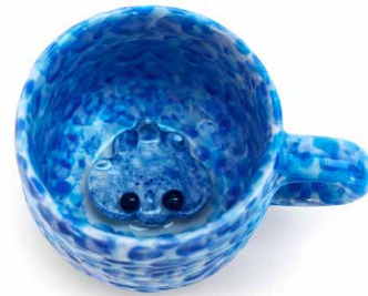
TAZA MANTARRAYA SORPRESA