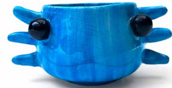
TAZA CARA DE AJOLOTE AZUL 250 ML