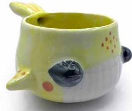
TAZA DE BALLENA PIÑA