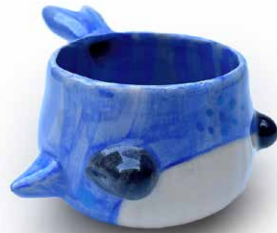
TAZA DE BALLENA BLUEBERRY