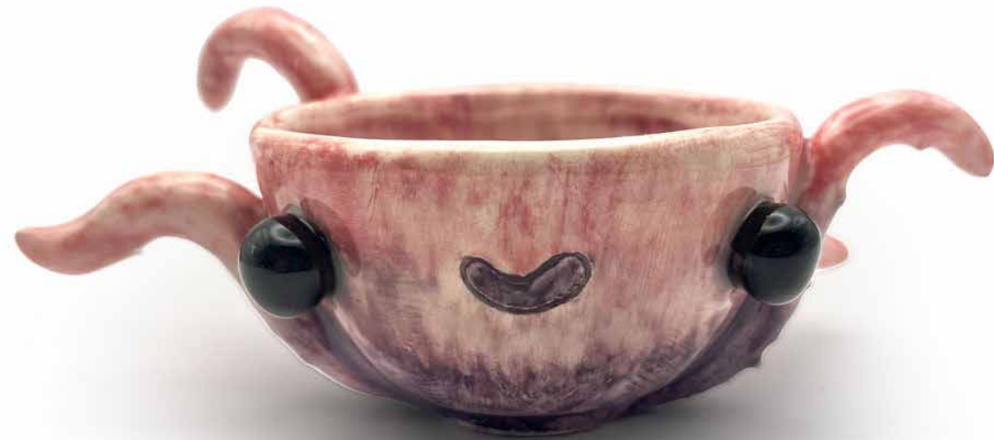
JUEGO 4 MEZCALEROS PULPO MEZ-PUL-23