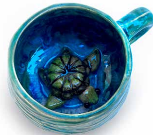
TAZA TORTUGA SORPRESA

TAZA (200ml) BALLENA SORPRESA TA-BI-CH-22