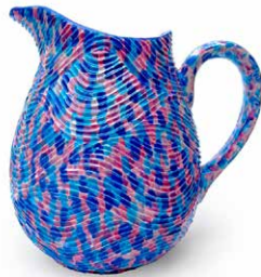
JARRA PEZ PAYASO