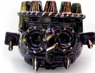
TAZA TLÁLOC DETALLES DE ORO