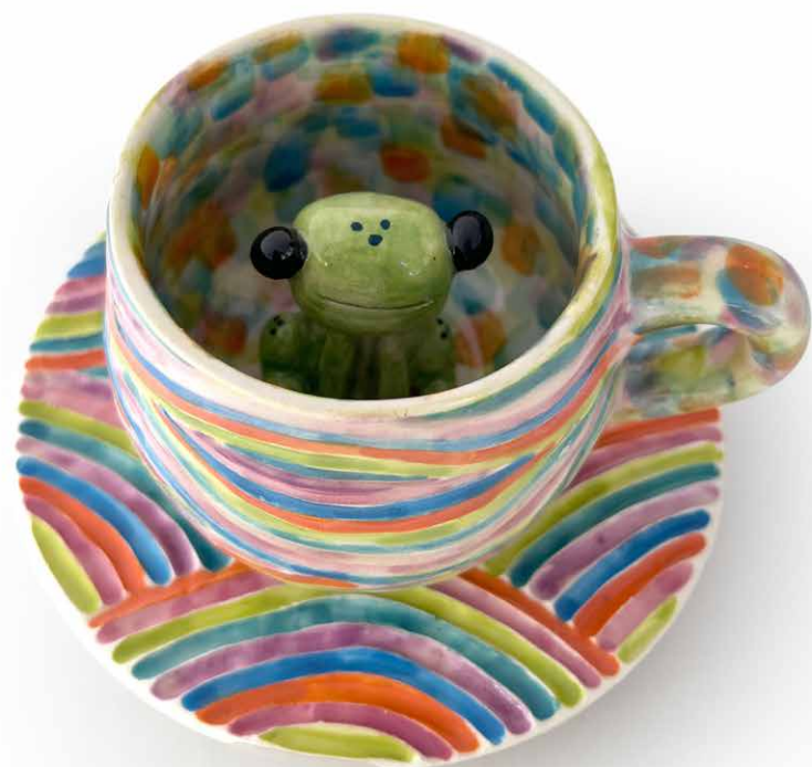
TAZA (200ml) RANA CON PLATO TA-TOR-IN-CH-22