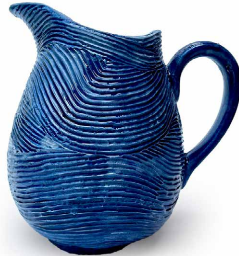
JARRA MAR PROFUNDO